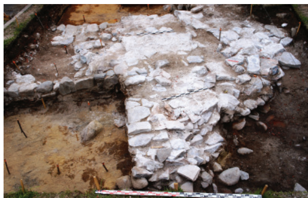
Рис. 3. Церковь Воскресения Господня. 2017. Фундамент. Вид с запада