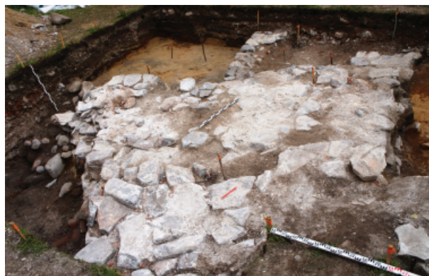
Рис. 2. Церковь Воскресения Господня. 2017. Фундамент. Вид с юга