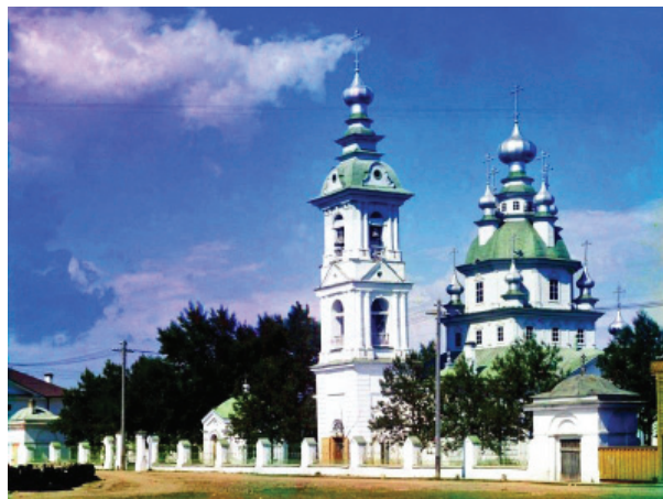
Рис. 1. Петропавловск. Церковь Воскресения Господня. 1915 г. Вид с юго-востока

В 1875 г. в связи с окончанием многолетнего строительства нового пятиглавого каменного кафедрального собора – уменьшенной копии московского храма Христа Спасителя – вблизи Святодуховской церкви по указу Олонецкой духовной консистории она была переименована во имя Воскресения Христова (горожане её называли «старым собором») 2 К началу XX в. в соборе были четыре