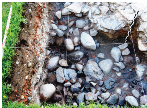
Рис. 6. Церковь Воскресения Господня. 2017. Подвал колокольни. Вид с юга

законы 1723 и 1771 гг. «о незахоронении умерших в городах при церквях» (Указ от 23 октября, 1830. С. 130; Указ от 24 декабря, 1830. С. 409)