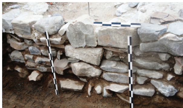
Рис. 4. Церковь Воскресения Господня. 2017. Фундаментная кладка западной стены

менялись ли какие-то субструкции из дерева при сооружении фундамента Воскресенского собора, пока не представляется возможным. Выброс грунта из траншей использовался в качестве подсыпки поверхности внутри и снаружи храма. Хорошо видна разница основного фундамента храма, по-