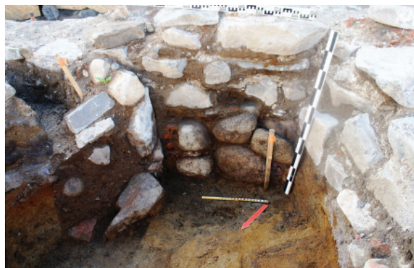
Рис. 5. Церковь Воскресения Господня. 2017. Фундаментная кладка центральной части стены